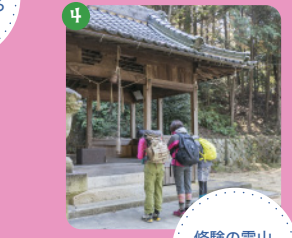
6 修験の霊山。お参りしてから登ろう。