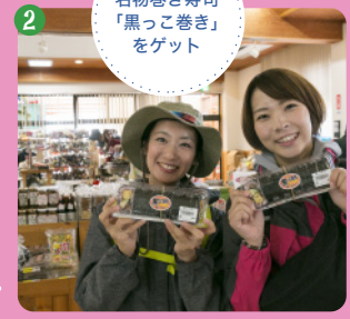
2 名物巻き寿司「黒っこ巻き」をゲット