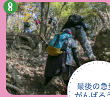
8 最後の急登。がんばろう!