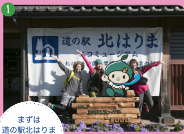
1 まずは道の駅北はりまエコミュージアムへ!