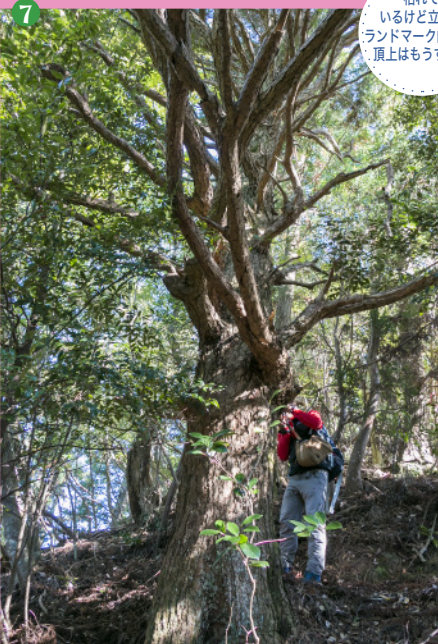
7 枯れていくけど立派なランドマーク的存在。頂上はもうすぐ!