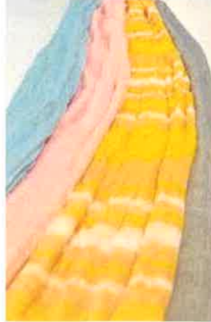
播州織ストール 8名