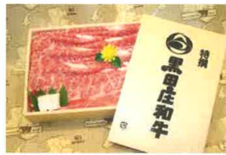
黒田庄和牛すき焼きセット(約800g) 10名