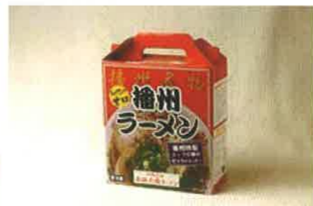
播州ラーメン(3食入り) 12名