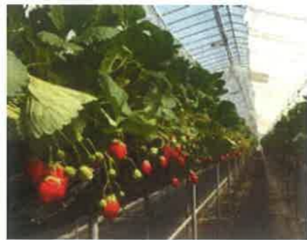
イチゴ狩りペア招待券 20名