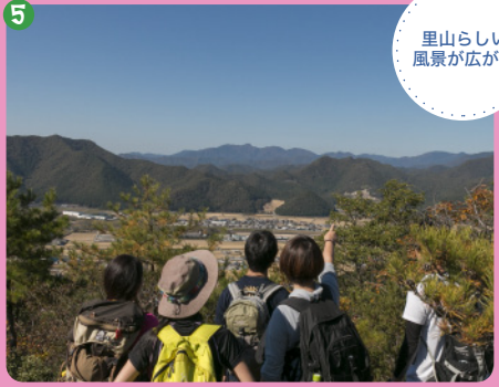
5 里山らしい風景が広がる