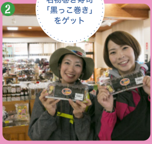
2 名物巻き寿司「黒っこ巻き」をゲット