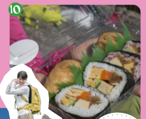
10 おたのしみの巻き寿司でごほうび山飯を楽しもう