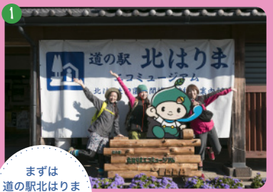
1 まずは道の駅北はりまエコミュージアムへ！