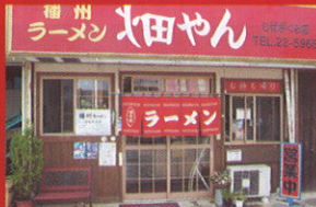
畑やんラーメン [しばざくら店] 〒677-0054 兵庫県西脇市野村町786-2 TEL 0795-22-5966