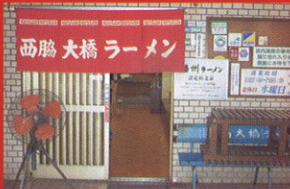
西脇大橋ラーメン 〒677-0044 兵庫県西脇市上野432 TEL 0795-22-4886