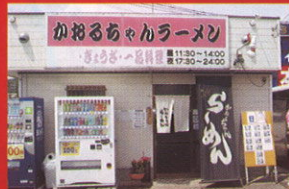
かおるちゃんラーメン 〒677-0044 兵庫県西脇市上野185 TEL 0795-23-3837