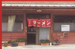
タッチャンラーメン 〒679-1201 兵庫県多可郡多可町加美区豊部232-5 TEL 0795-35-0010