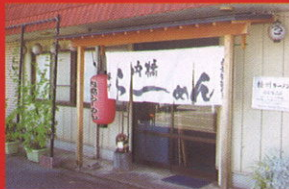
内橋ラーメン 〒677-0003 兵庫県西脇市西田町181 TEL 0795-22-3922