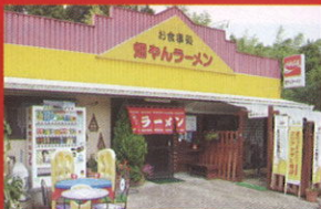
畑やんラーメン本店 〒679-1124 兵庫県多可郡多可町中区森本805-10 TEL 0795-32-2981