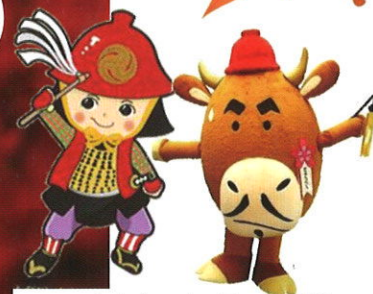
へそのかんちゃん&黒田牛兵衛