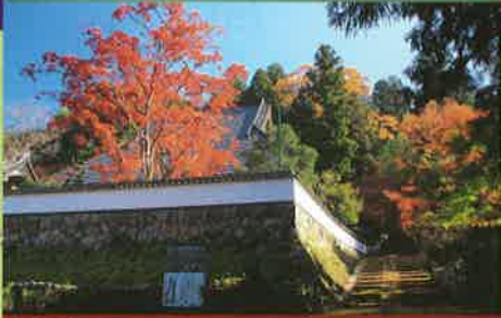
荘厳寺 【黒田家系図所蔵】

7世紀飛鳥時代に開基と伝えられる古刹で、県重要文化財指定の多宝塔と紅葉の名所として有名です。平成23年に発見された黒田氏の発生から滅亡までの歴代が記されている「荘厳寺本黒田家系図」を所蔵しています。