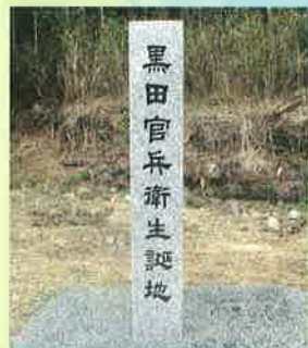
黒田官兵衛生誕地

中世・戦国時代の山城で黒田家代々の居城。全体の城郭は不明ですが、帯曲輪や堅堀ともみえる遺構があります。また、城下には平時の城主居館「多田構居」があり、建物や堀の跡が発掘されています。