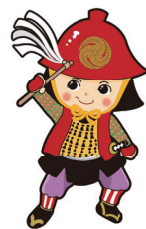
官兵衛の里・西脇市 イメージキャラクター 『へそのかんちゃん』