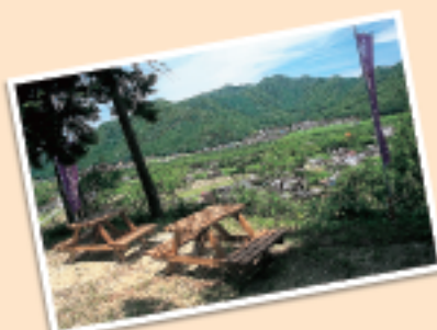
山上からの黒田集落の眺め

中世・戦国時代に築かれた山城で、黒田氏9代の居城。現在稲荷神社がある比高約40mの半独立山上に城があったと考えられますが、全体の城郭は不明ですが、帯曲輪・竪堀・堀底道とも見える遺構があります。さらに、東へ続く尾根上にも土橋状の遺構や人工的地形とも見える箇所がありますが、実態はよくわかっていません。