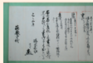
「莊嚴寺本黒田家略系図」

比延山城は、黒田城の南、現在の西脇市比延町にあった山城で、黒田氏と比延氏との間には代々姻戚関係があったとされます。この家系図を莊嚴寺に奉納したのも比延氏末裔を名のる一族です。