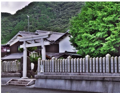
石上神社 (西脇市板波町)

境内には、長径約 30 メートル、短径約 20 メートル、高さ 5 メートルの巨岩が突出しており、古くから信仰の対象となっていたと考えられます。