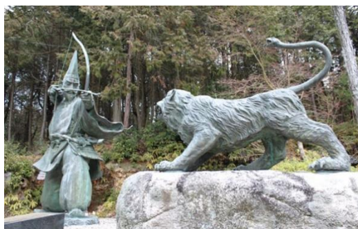
長明寺 (西脇市高松町)

海拔約 260 メートルの五峰山の頂上にあり、播磨高野と呼ばれ真言 75 名刹の一つに数えられています。南北朝時代の正平 7 年 (1352) 足利尊氏と弟直義との不和から生じた太平記の光明寺合戦は有名で、本堂裏に本陣跡があります。